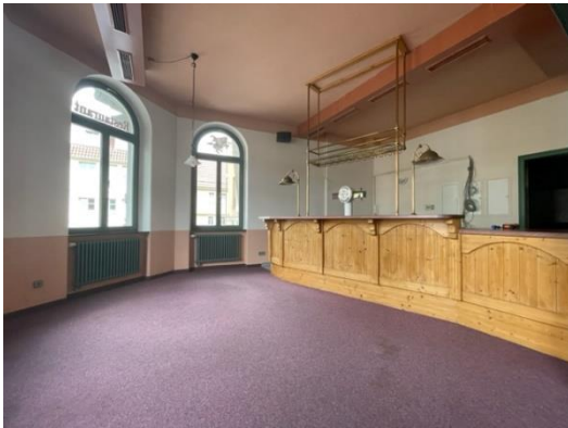
Gastraum 1 mit Theke