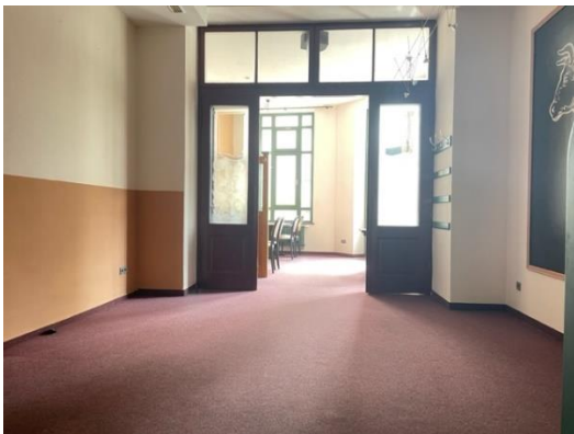
Gastraum 3 +4